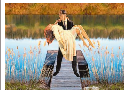
▲ Bassorilievi fotografici Le opere di Francesco Jodice al Forte del Gavi